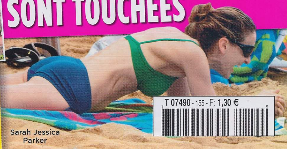
Sarah Jessica Parker

ULTRA-MAIGREUR TOUTES LES STARS SONT TOUCHÉES