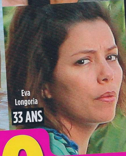
Eva Longoria 33 ANS