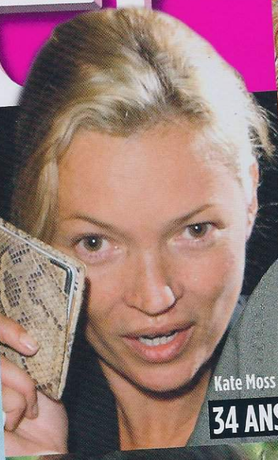
Kate Moss 34 ANS