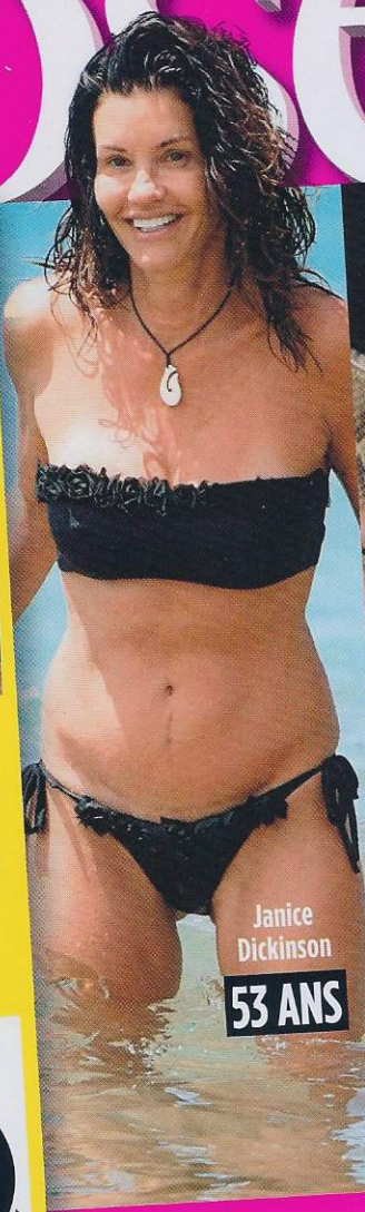
Janice Dickinson 53 ANS