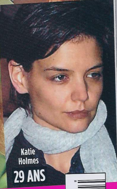
Katie Holmes 29 ANS