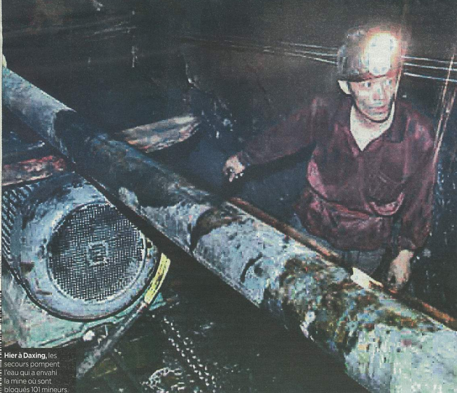
Hier à Daxing, les secours pompent l'eau qui a envahi la mine où sont bloqués 101 mineurs.

Plus de 6 000 tués chaque année: les mineurs chinois paient un lourd tribut à la croissance explosive de l'économie. Page 2